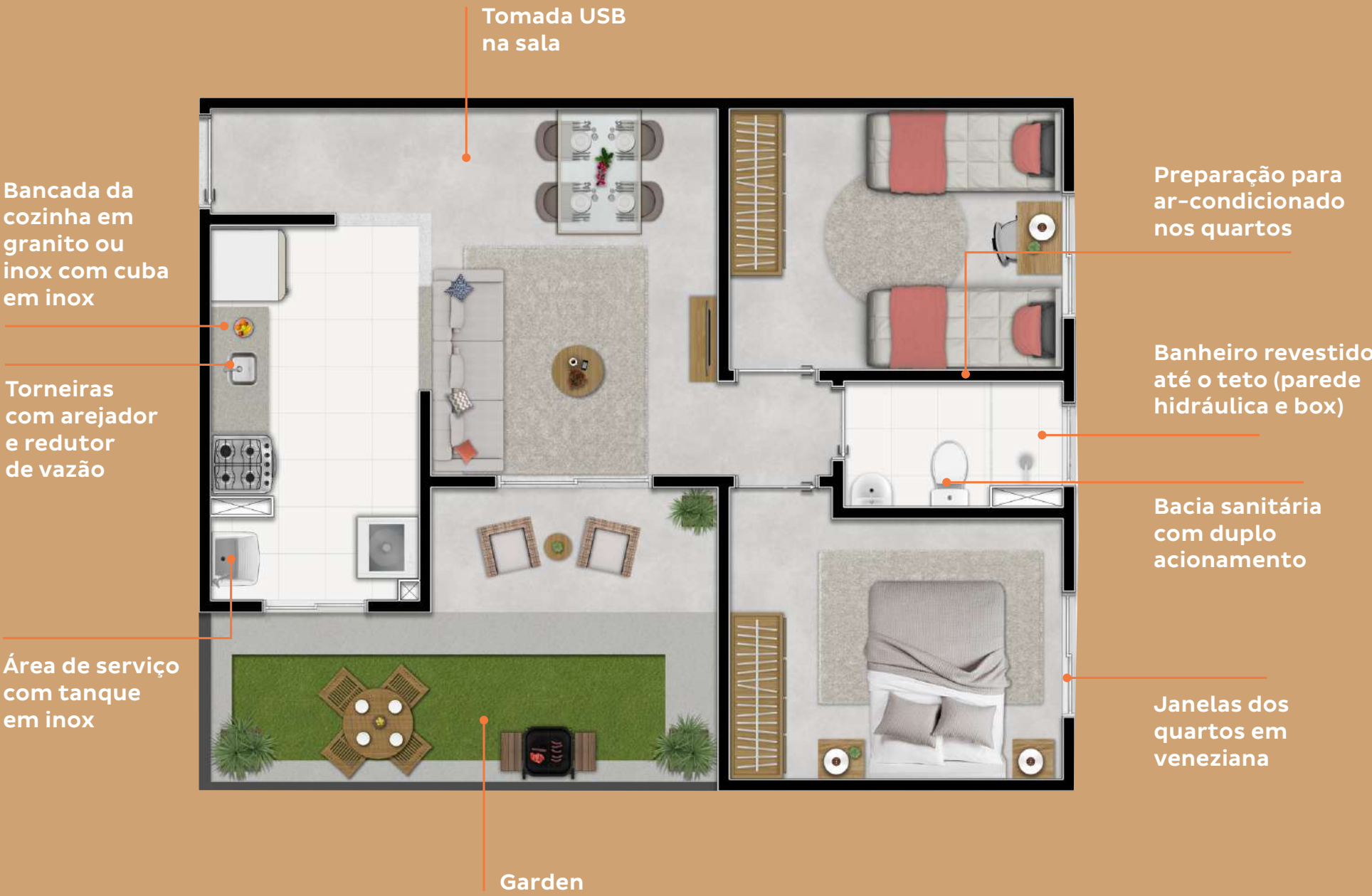
TORRES 01, 05, 06 E 07 APARTAMENTO TÉRREO COM GARDEN: 55,81 M² (FINAIS 1, 2, 3 E 4)

Unidades PCD: Torre 1: 1601, 1602, 1603 e 1604 Torre 5: 1603 e 1604 Torre 6: 1601, 1602, 1603 e 1604 Torre 7: 1601, 1602, 1603 e 1604.