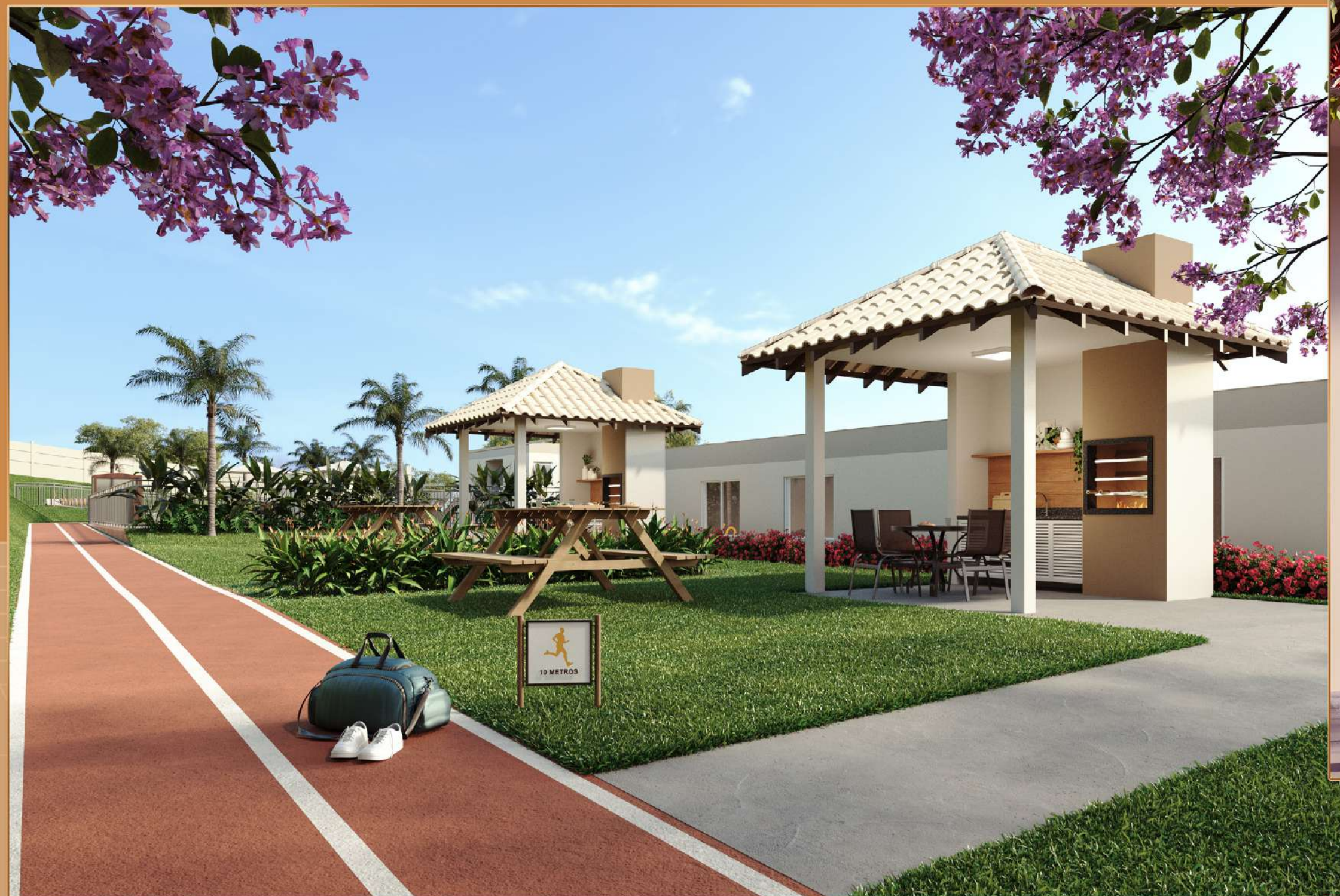
PISTA DE CAMINHADA

PERFEITO PARA ATIVIDADES AO AR LIVRE E CONVÍVIO SOCIAL.