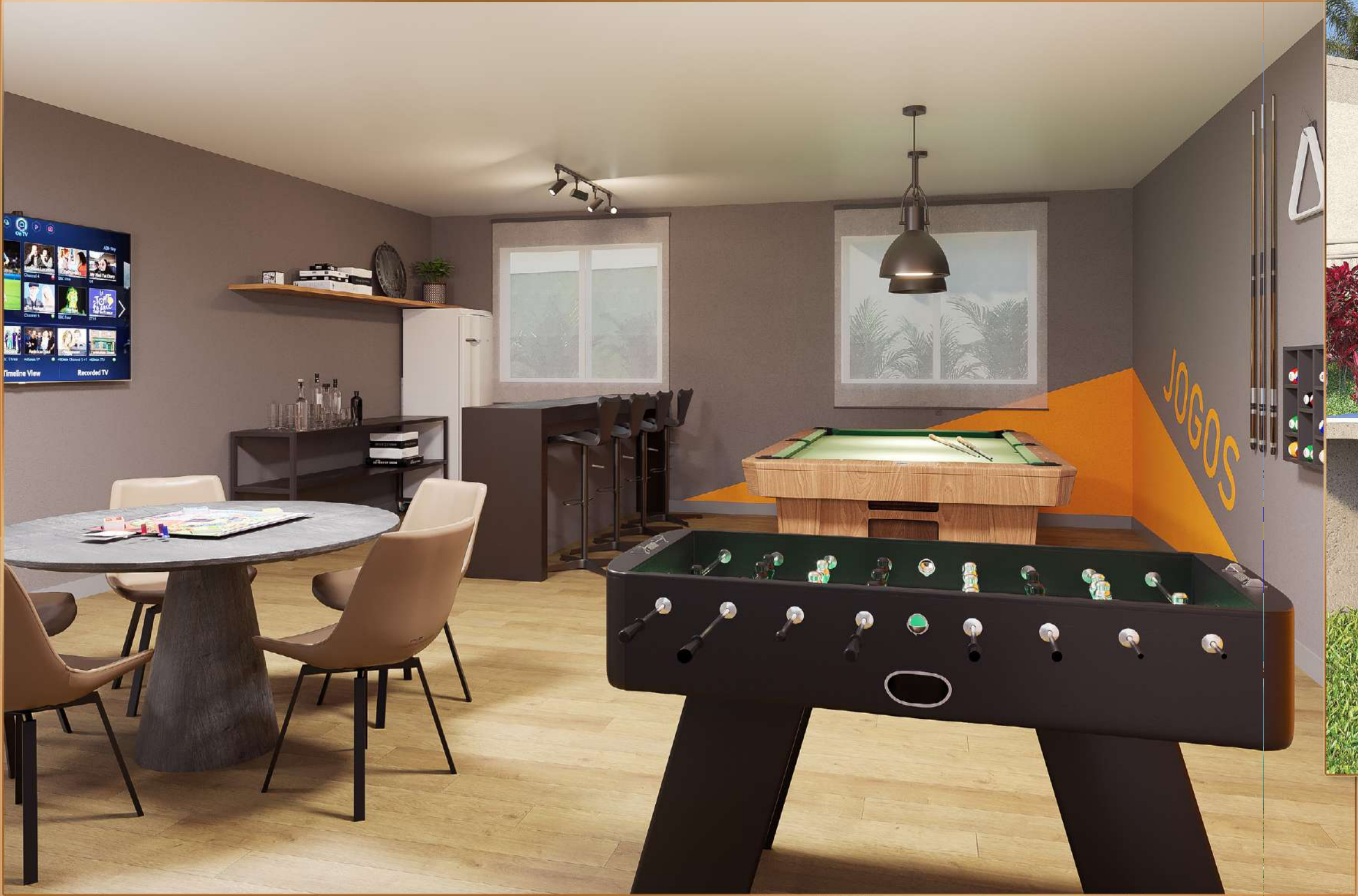
ÁREA DE JOGOS INTERNA