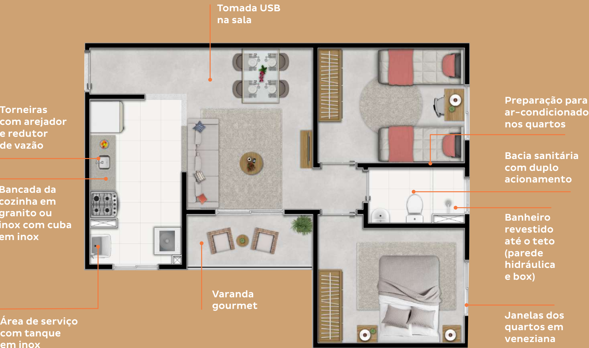
TORRES 01, 05, 06 E 07 APARTAMENTO TIPO COM VARANDA: 47,23 M² (FINAIS 1, 2, 3 E 4)

Unidades PCD: Torre 1: 1601, 1602, 1603 e 1604 Torre 5: 1603 e 1604 Torre 6: 1601, 1602, 1603 e 1604 Torre 7: 1601, 1602, 1603 e 1604.