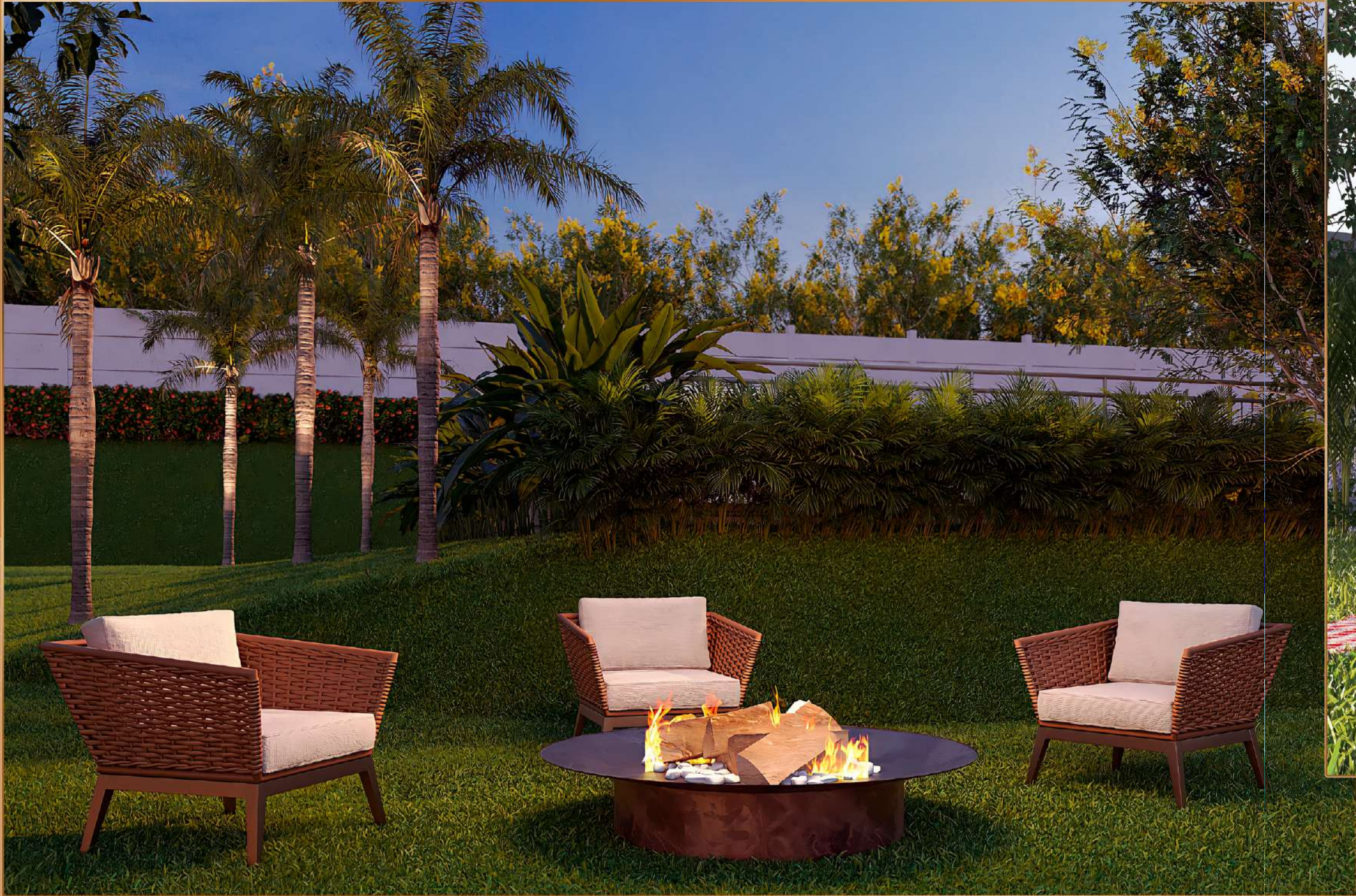
PRAÇA DO LUAU