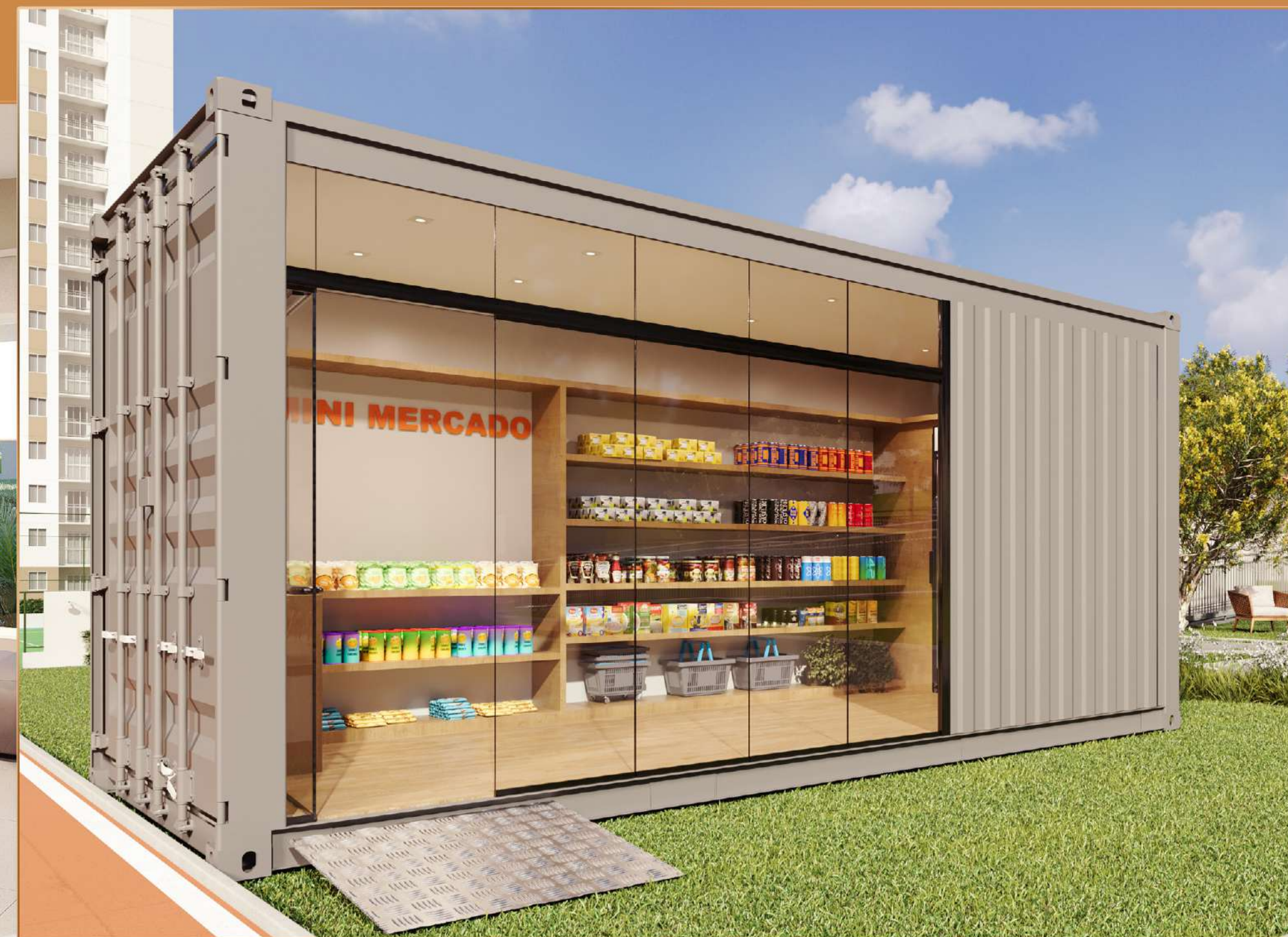
PREPARAÇÃO PARA MERCADINHO