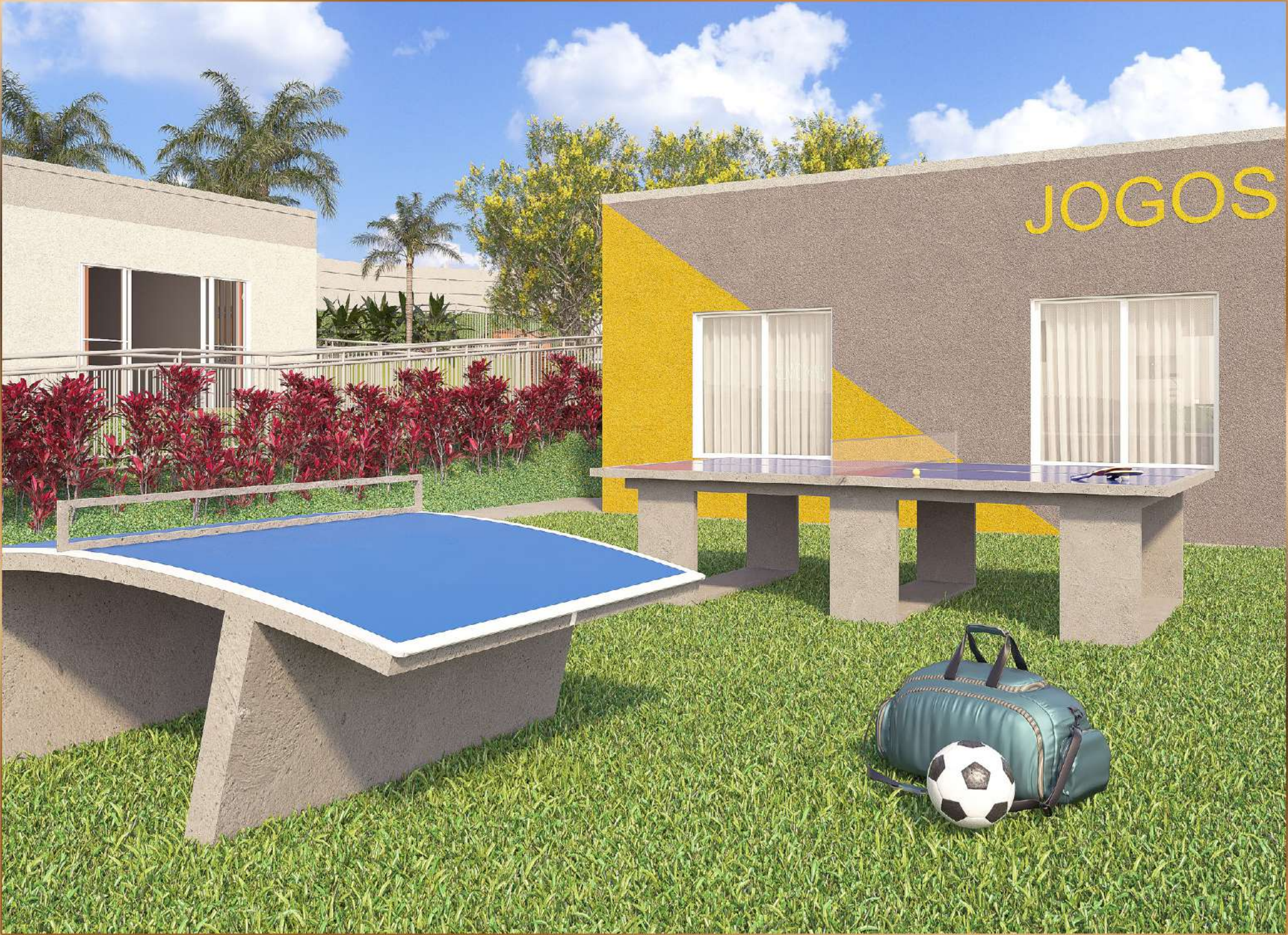
ÁREA DE JOGOS EXTERNA